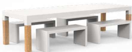
BORRA BOIS DUR